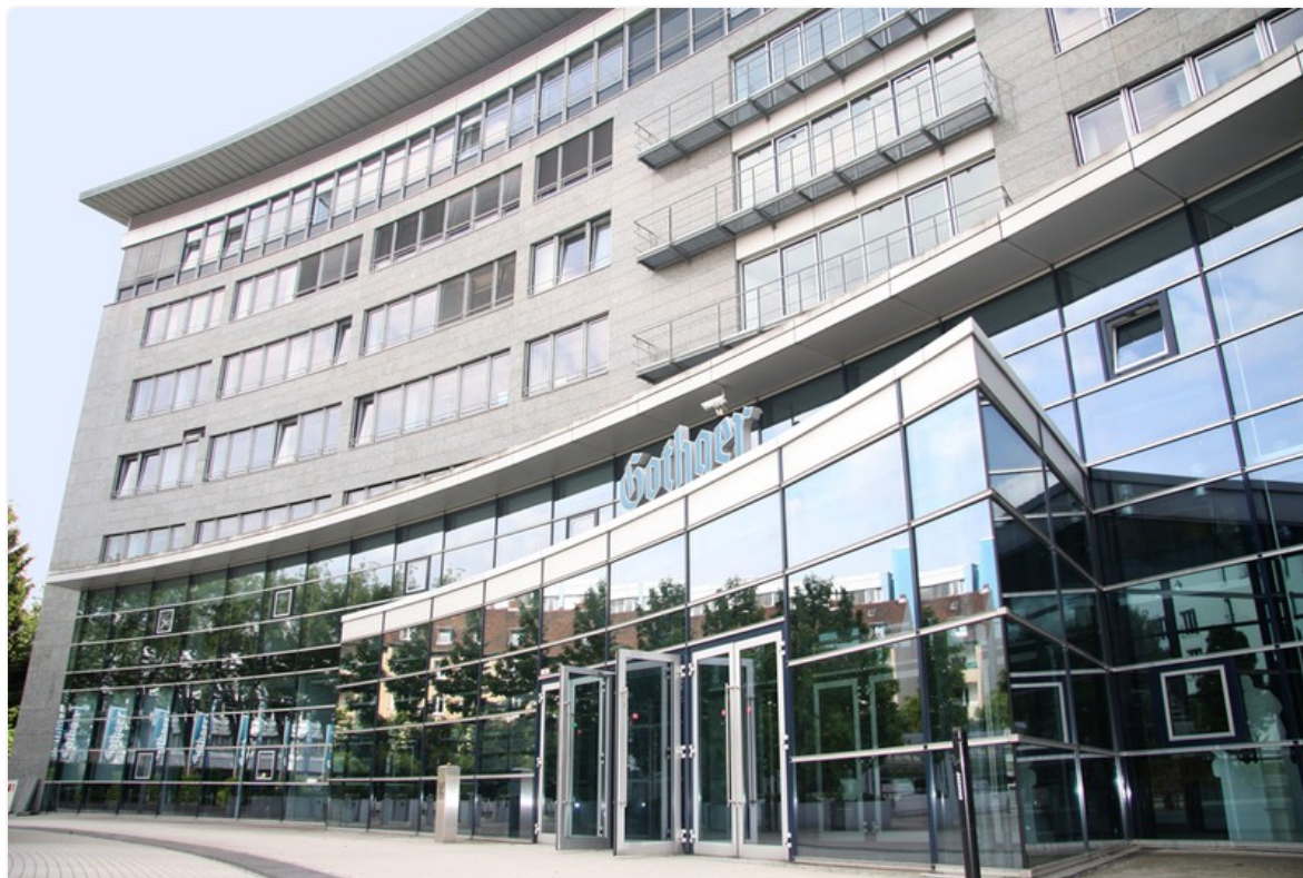
Gothaer Allgemeine Versicherung AG in der Gothaer Allee 1 in Köln