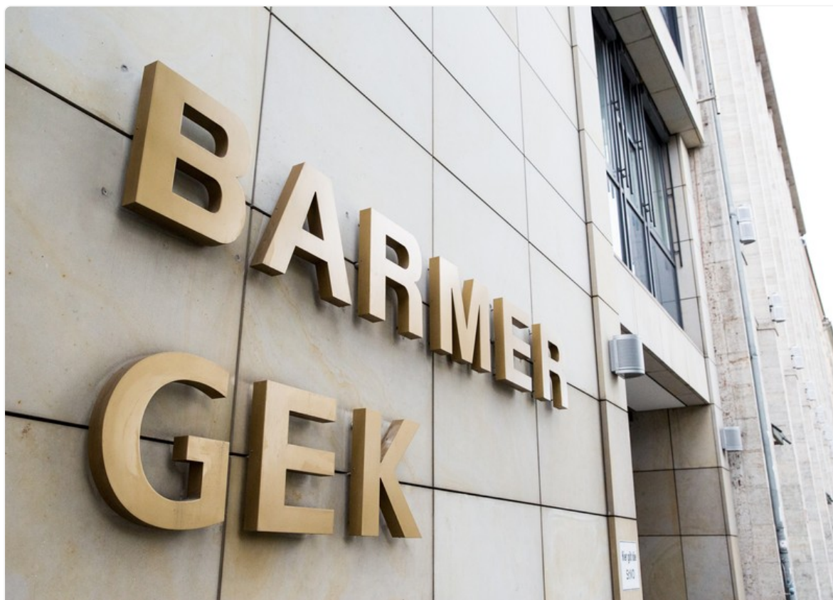
Logo der BARMER GEK am Standort Berlin