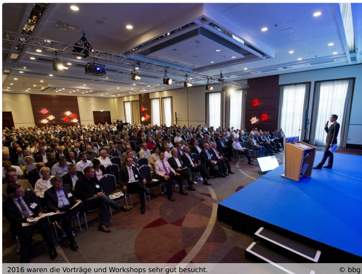
2016 waren die Vorträge und Workshops sehr gut besucht.

Alle Programmpunkte wurden von der Brancheninitiative „gut beraten“ geprüft – so können insgesamt 7 Weiterbildungspunkte gesammelt werden.