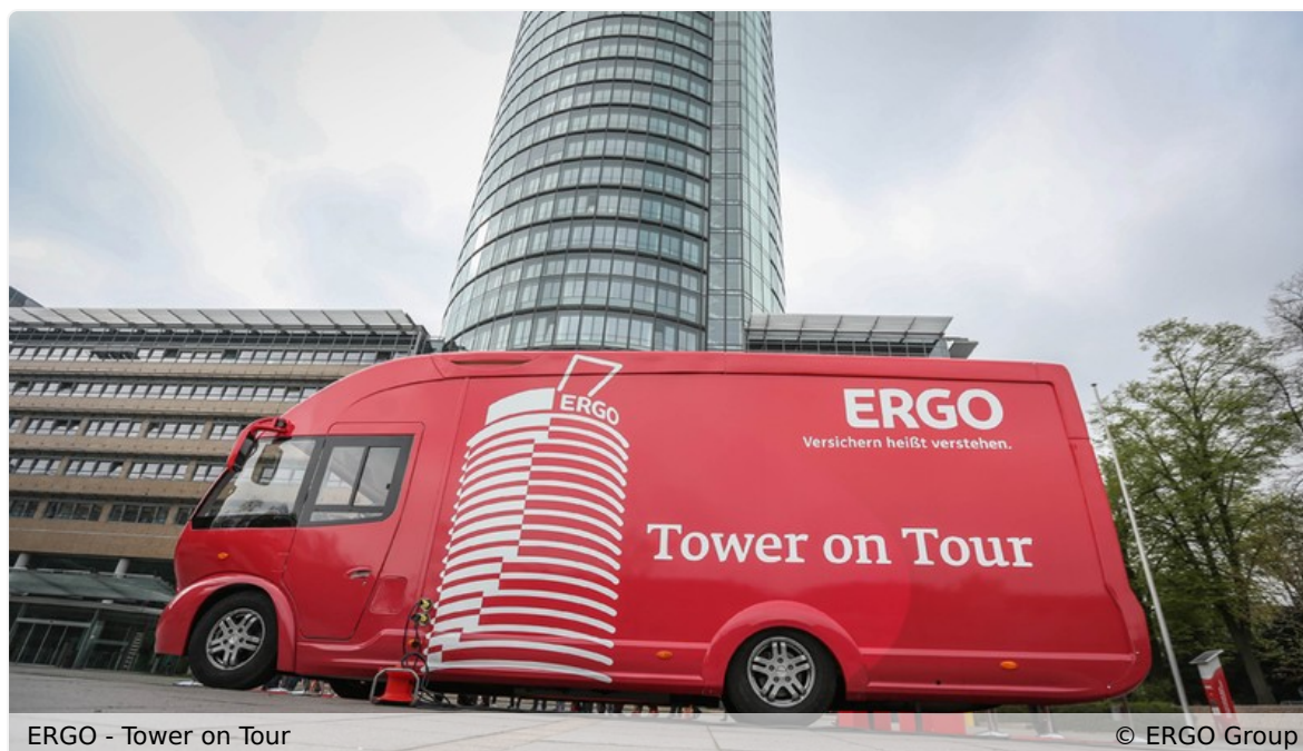
ERGO - Tower on Tour