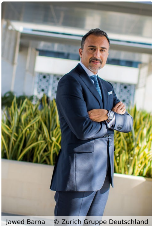
Jawed Barna © Zurich Gruppe Deutschland

Doch Vorsicht: Seit 2001 gibt es für alle Arbeitnehmer, die nach dem 1. Januar 1961 geboren sind, nur noch die Erwerbsminderungsrente. Die volle Erwerbsminderungsrente wird nur gezahlt, wenn Betroffene nicht mehr einer dreistündigen Tätigkeit pro Tag nachgehen können - unabhängig vom gelernten Beruf. "Viele denken aber nicht daran, dass das Solidarsystem aufgrund des demografischen Wandels, der steigenden Kosten im Gesundheitswesen oder des verhaltenen Wirtschaftswachstums vor erheblichen finanziellen Herausforderungen steht. Das staatliche Absicherungssystem reicht längst nicht mehr aus, um den gewohnten Lebensstandard auch nur annähernd zu halten. Wir gehen davon aus, dass die staatliche Absicherung daher weiter eher ab- als zunehmen wird. Die private Vorsorge wird, insbesondere im Niedrigzinsumfeld, immer wichtiger", betont Barna.