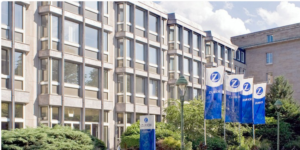
Zurich Gruppe Deutschland Gebäude der Direktion Bonn